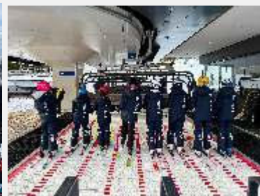
Text und Bilder: Martina Rachtl