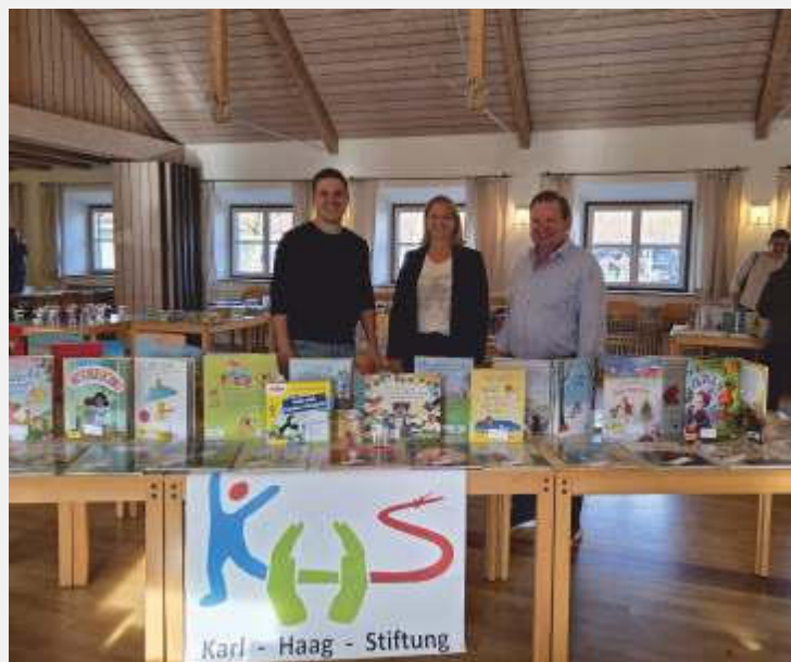
Text und Bild: Michaela Koller