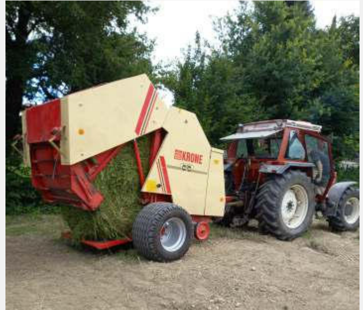
Text und Bilder: Gerhild Farcher