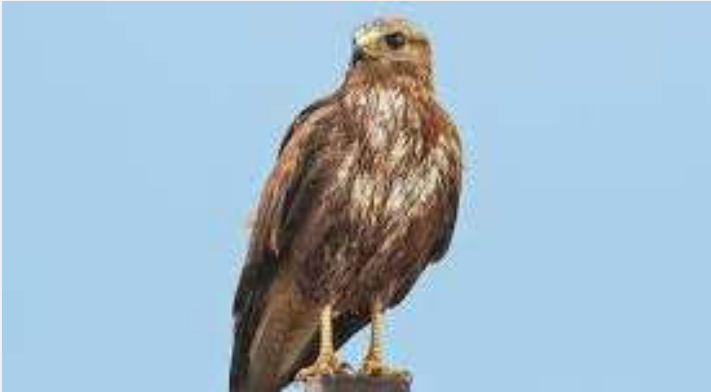
Text und Bilder: Adi Bauer

Ich freue mich jedes mal, wenn ich Feldhasen sehe, in den Sojafeldern ist ihr Lieblingsplatz. Aber bei einer Überpopulation tritt auch schnell mal eine Krankheit auf, die ganze Bestände auslöscht. Ich denke, die Aufgabe der Landwirtschaft ist es, ganzjährig Lebensraum und vielfältige Nahrungsmöglichkeiten und Rückzugsmöglichkeiten zu schaffen und die Jäger sorgen für einen artenreichen, unsere Kulturlandschaft zuträglichen Wildtierbestand. Und wer gerne mal Wild isst, für den sollte der heimische Jäger die erste Adresse sein.