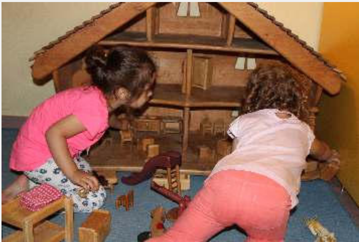
Text und Bilder: Monika Hartinger