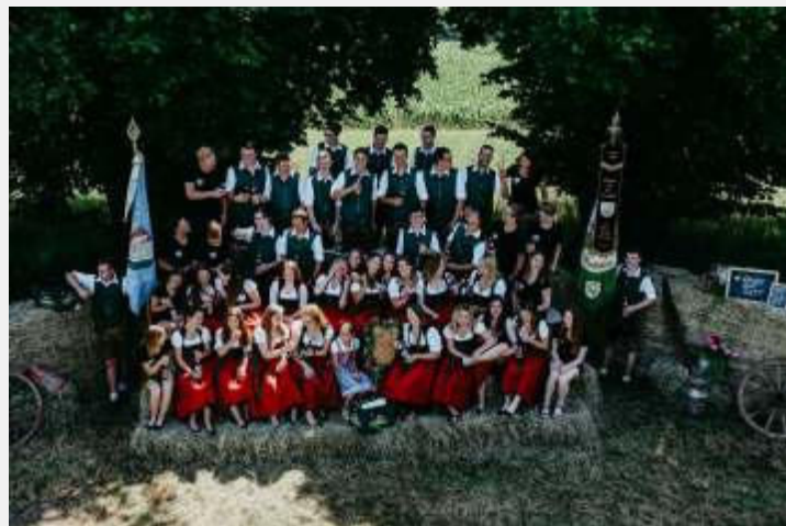
Text und Bild: Andrea Oberbauer